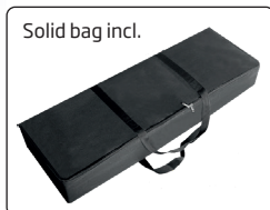
Solid bag incl.