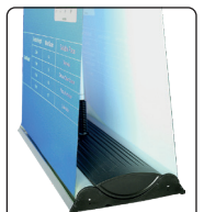
Double sided roll-up